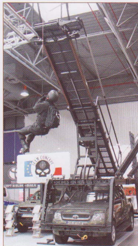
Niewątpliwie najwyższy eksponat na tegorocznej wystawie – Platforma Szturmowo-Ewakuacyjna C3, zainstalowana na samochodzie Toyota Hilux.